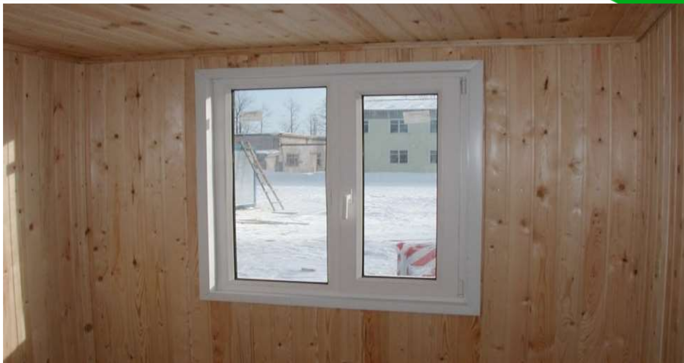
«Проходная», панели МДФ (цвет бук)